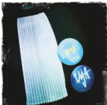
COMITE DECENTRALISE DE MONTPELLIER