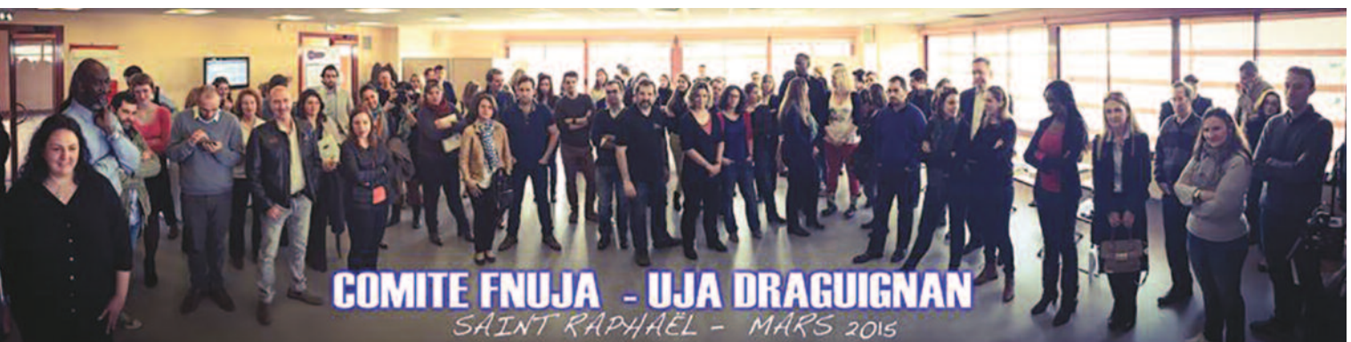
COMITE FNUJA - UJA DRAGUIGNAN SAINT RAPHAEL - MARS 2015