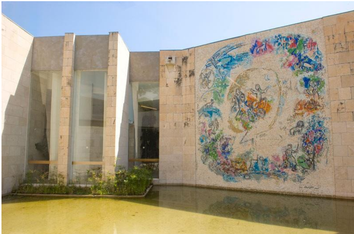
Musée National René Chagall

Chagall, Renoir, Berlioz, Gary, Matisse, ont tous succombé aux charmes niçois, tu n'y résisteras pas !