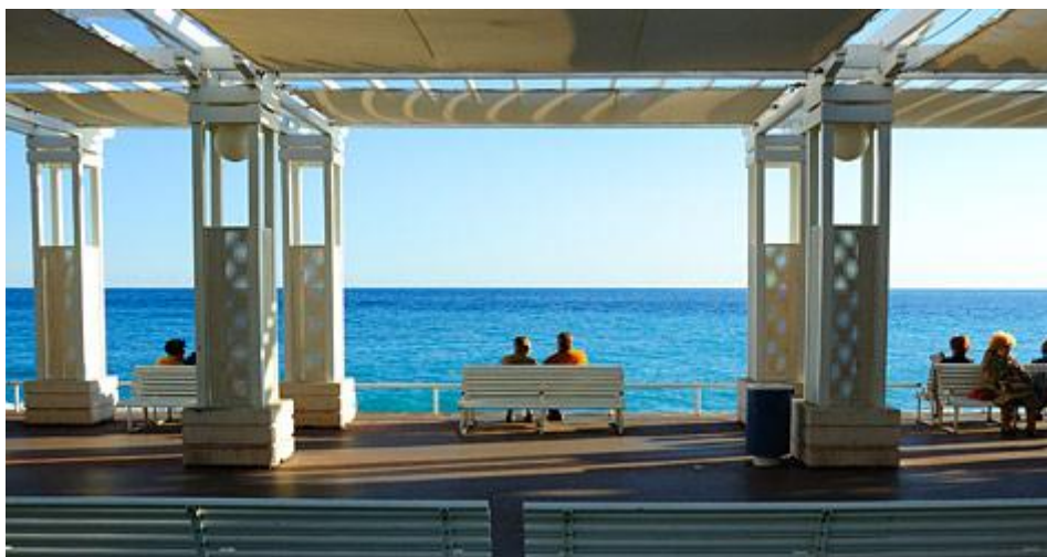
La promenade des Anglais