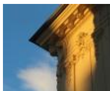
Hôtel Le Seize - (3 étoiles - dizaine de chambres disponibles)

Nos prix s'entendent nets, par jour, taxes et service inclus. Ils sont sujets à modification, si ces taux et taxes étaient modifiés par les autorités.