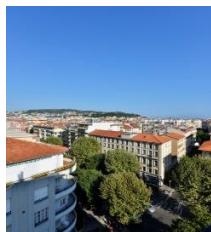
Hôtel HOLIDAY INN (4 étoiles)

N'attendez pas pour profiter des tarifs privilégiés accordés par nos partenaires hôteliers situés dans un même périmètre spécialement pour votre plus grand confort !