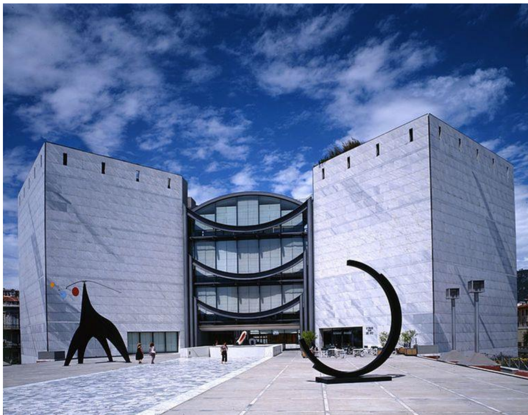
MAMAC (Musée d'Art Moderne et d'Art Contemporain)